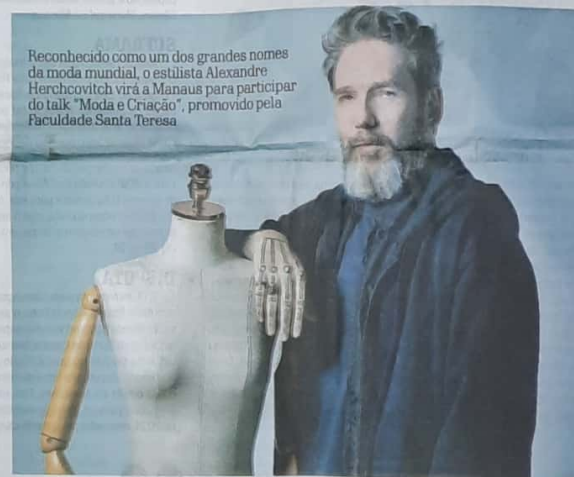
Reconhecido como um dos grandes nomes da moda mundial, o estilista Alexandre Herchovitch virá a Manaus para participar do talk "Moda e Criação", promovido pela Faculdade Santa Teresa