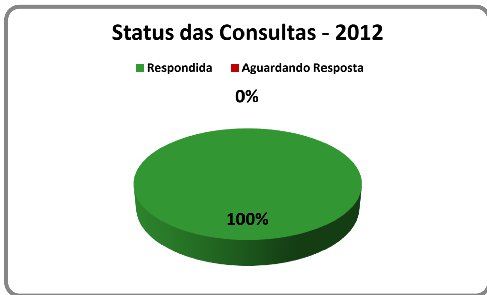
Gráfico 3. Status das Consultas